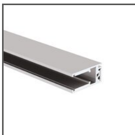
KRAV-810 A18016AZM Ref. arch 18016