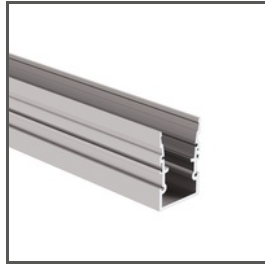
HR-MAX-TW A01828 Ref. arch C1828