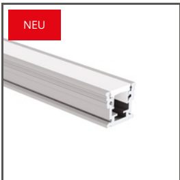
HR-MAX A01829+A01827+A01828 Ref. arch C1829+C1827+C1828