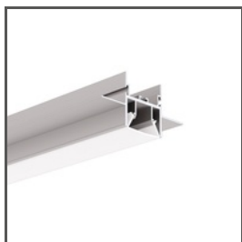
FOLED A08332V1 Ref. arch B8332V1