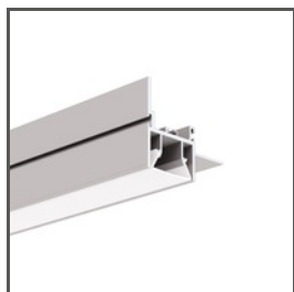
FOLED-BOK A08334V1 Ref. arch B8334V1