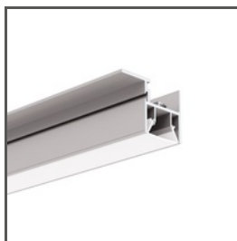
FOLED-SUF A08333V1 Ref. arch B8333V1