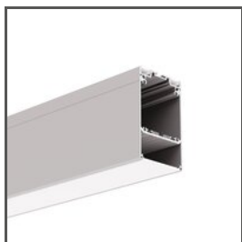
DES A18030 Ref. arch 18030